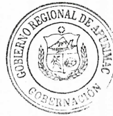
BALTAZAR LANTARON NUÑEZ Gobernador Regional Gobierno Regional de Apurímac